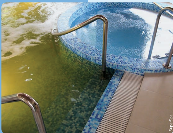
ДО применения АКВАФИНЕСС

С проблемой очистки плавательного бассейна или спа рано или поздно сталкивается любой владелец. Решить ее удастся путем невероятных затрат времени и сил. Ведь до недавнего времени по-настоящему эффективного универсального средства «все в одном» для очистки воды в бассейнах не существовало. На вопросы корреспондента ответил специалист по химии компании SuperSpa.